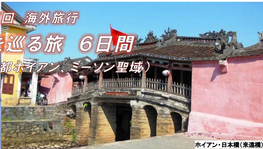
ホイアン・日本橋(来遠橋)