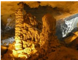
ハロン湾内の鍾乳洞