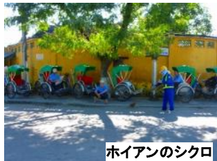
ホイアンのシクロ